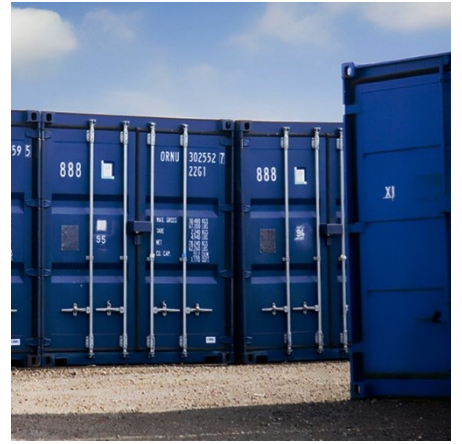
海外物流・コンテナG