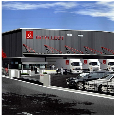
倉庫・物流センターG