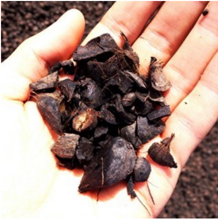
エコ・資源・エネルギーG