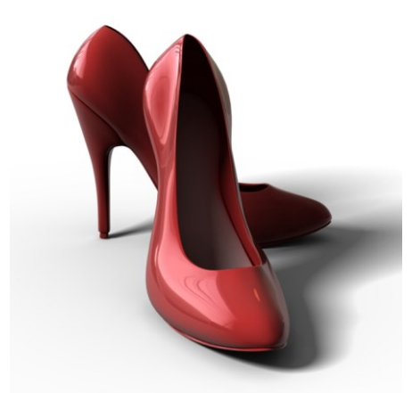
ファッション・輸入・販売支援G