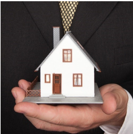
精密・引越・住宅・建材G