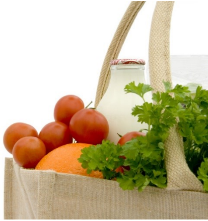
食品・冷凍・冷蔵G