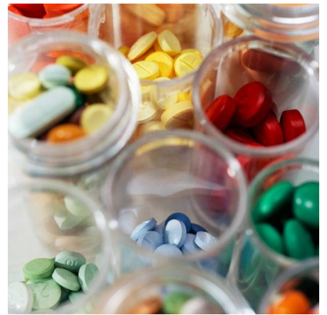
医薬・ドラッグ・化粧品G